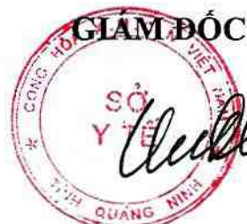
Vũ Xuân Điện